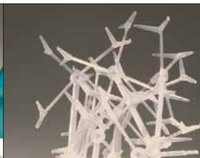
Plastični ostanki (drobni obrezki) za reciklažo.

Podjetje Kongskilde je specialist v prenosu, kompaktiranju in čiščenju pocesnih odpadkov / ostankov znotraj papirne, tiskarske in plastične industrije, kar vašemu podjetju omogoča direkten dostop do najnovejših, tržno naravnanih dognanj na področju obvladovanja odpadkov / ostankov.