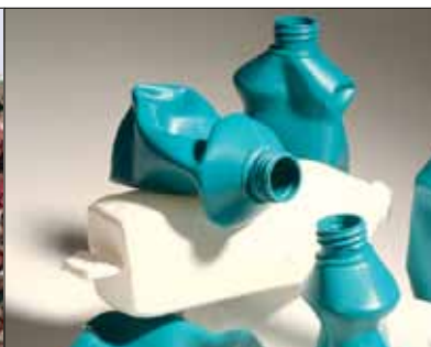
Končni plastični izdelki. Odobreni izdelki in izmet za reciklažo.