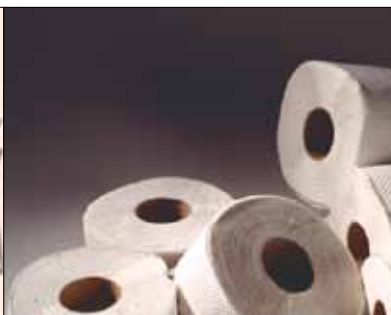
Obrezki iz proizvodnje toaletnega papirja.