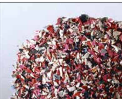
Predelava plastičnega odpada v kosmiče.