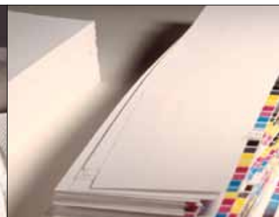
Obrezki v tiskarski industriji.