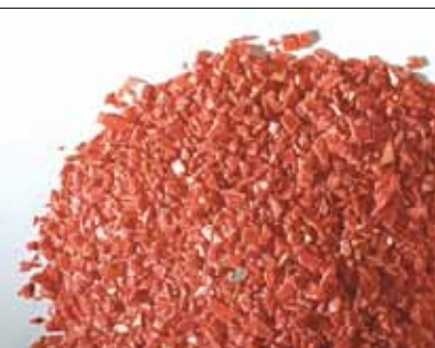
Recikliranje izmeta plastičnih granulatov.